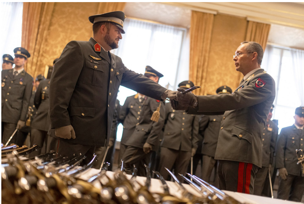
► ...und General Rudolf Striedinger