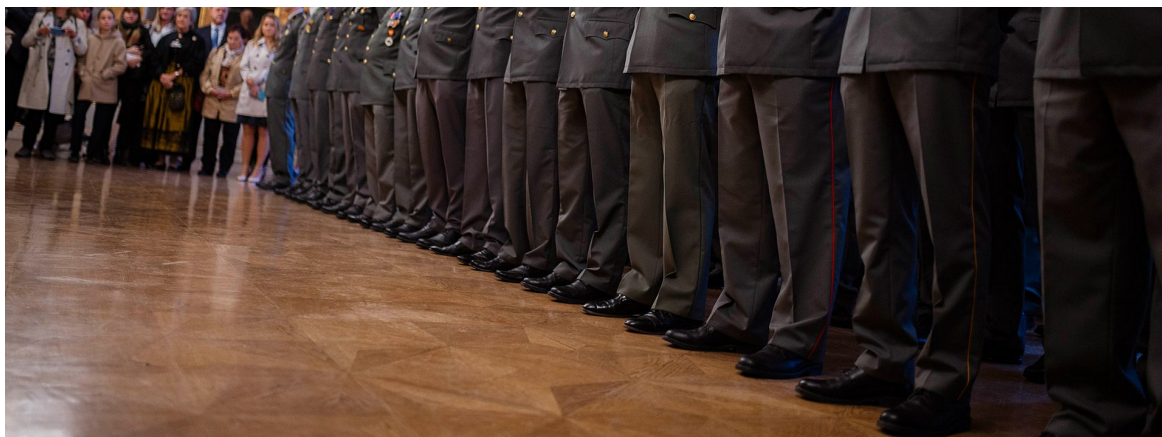
► ...zur Verleihung an die Leutnante der Miliz