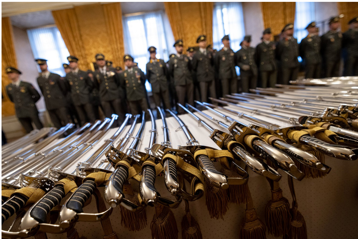
► Die Säbel liegen bereit...