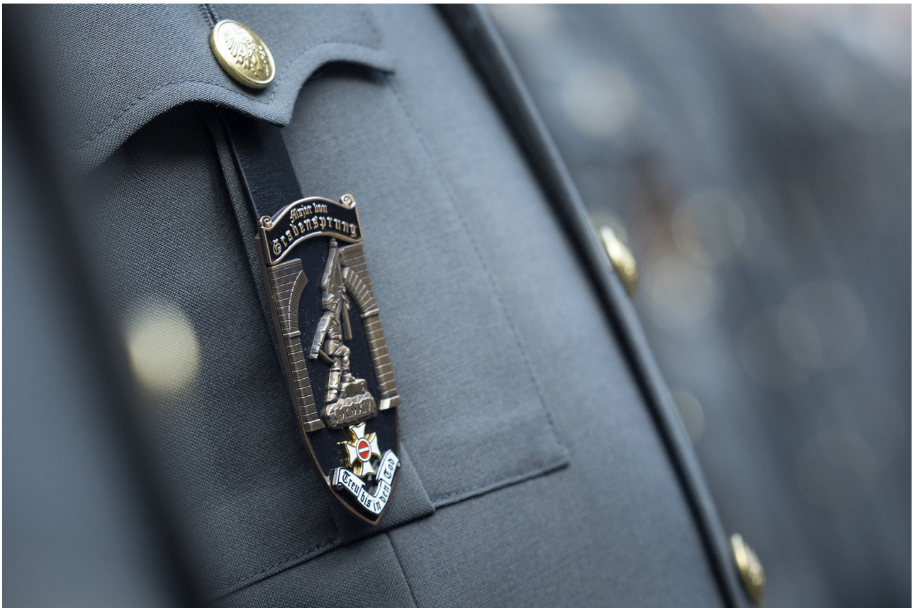
► Abzeichen des Jahrganges "Major von Grabensprung"