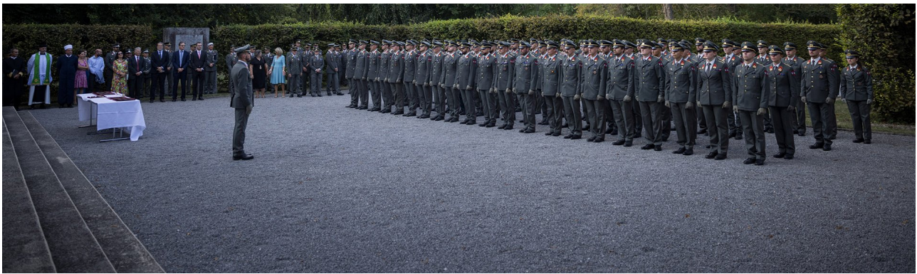
► Der Jahrgang ist angetreten