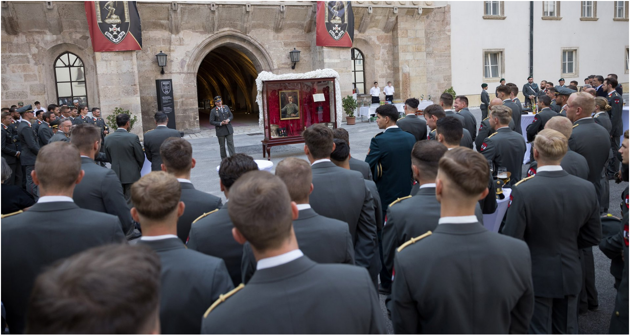
► Erklärung der Jahrgangsvitrine