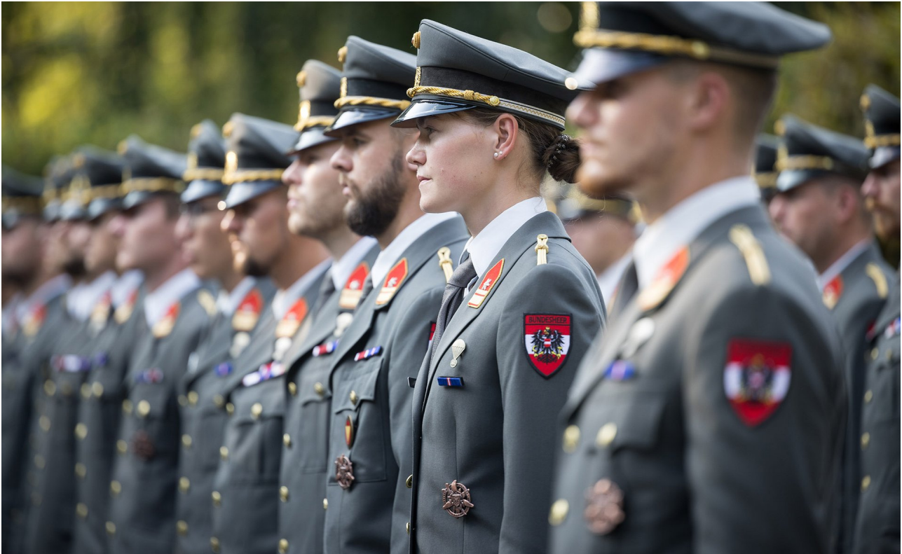
► Fähnriche des Jahrganges "Major von Grabensprung"