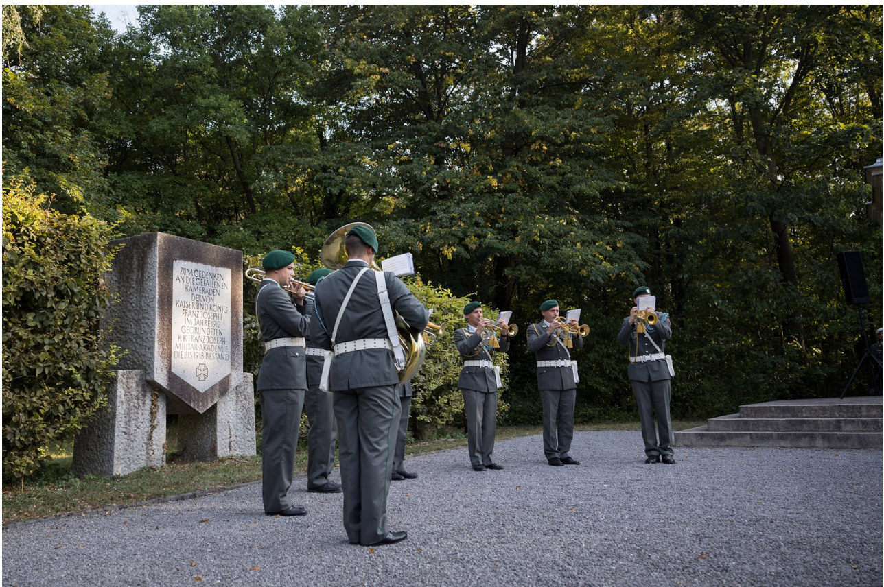
► Musikalische Umrahmung durch ein Ensemble der Militärmusik Burgenland