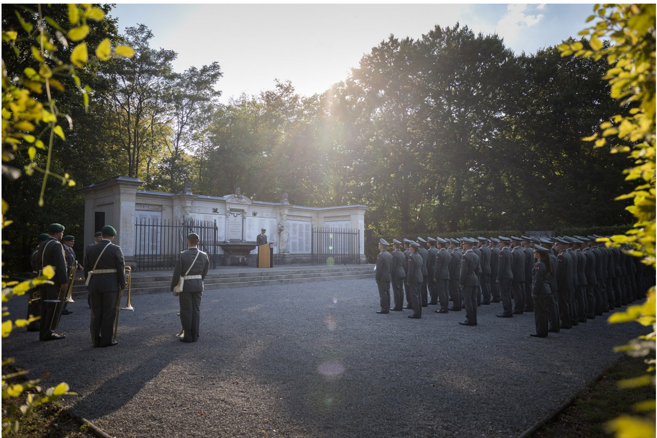
► Das Denkmal der 1400 - ein besonderer Ort

Dabei wurde der Namensgeber in einer durch Fähnrich Theodor Jauernik vorgetragenen Laudatio gewürdigt und nach der Segnung der Abzeichen wurden diese an die Angehörigen des Jahrganges verliehen.