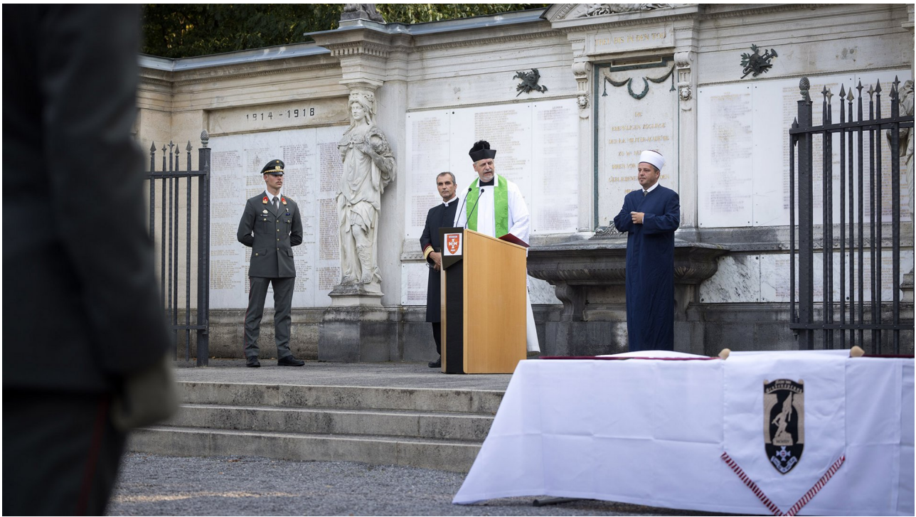
► Worte der Geistlichkeit