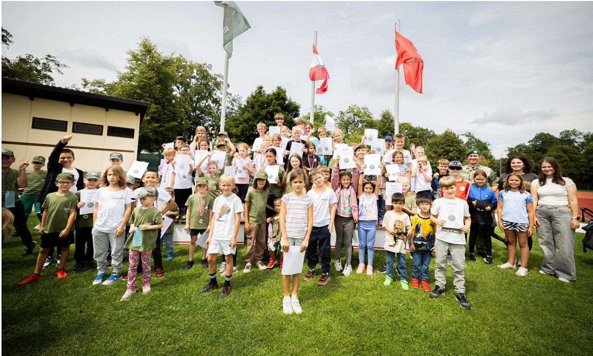
► Die Teilnehmer an der Kinderolympiade