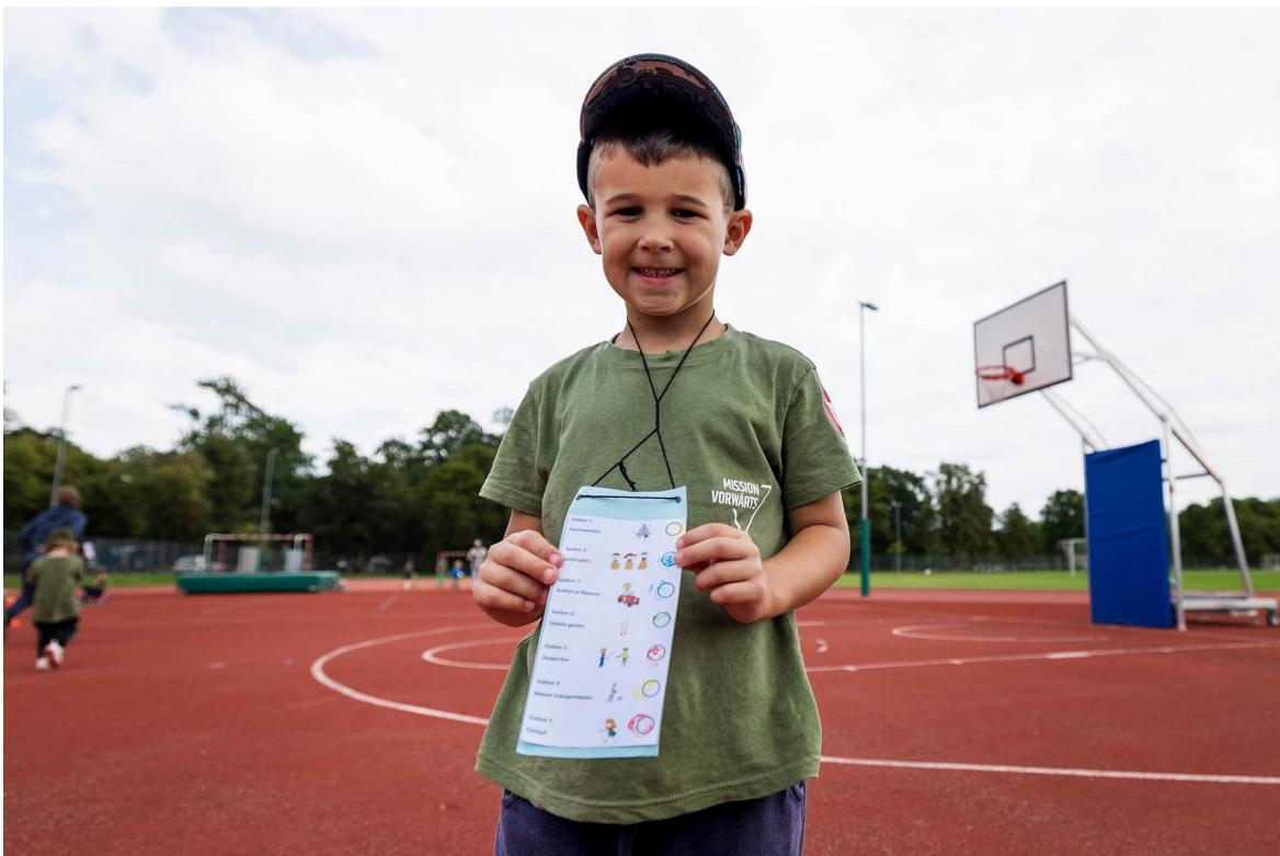
► Alle Stationen passiert