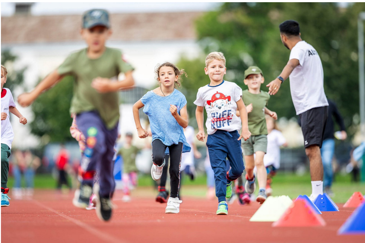
► Voller Einsatz bis ins Ziel