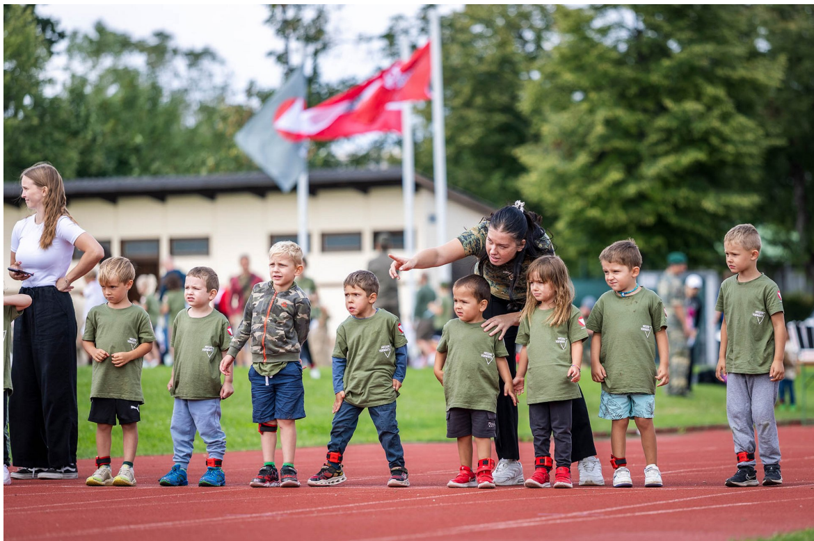
► Letzte Anweisungen vor dem Start

Neben einem Laufbewerb war bei einem Wettkampf mit mehreren Stationen vor allem Geschicklichkeit gefragt. So galt es die Herausforderungen "Dosenwerfen?", "Sackhüpfen?", "Stelzen gehen?", "Eierlauf?," zu bestehen.