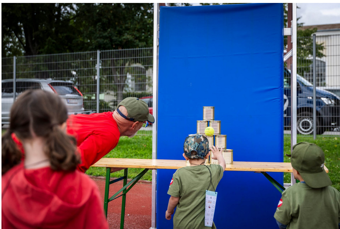
► Die Wurfentfernung ist natürlich abgestimmt auf das jeweilige Alter der Kinder