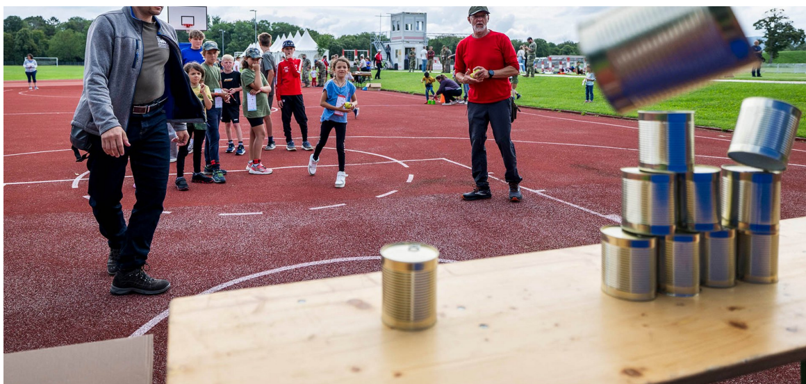
► Bewerb Dosenwerfen