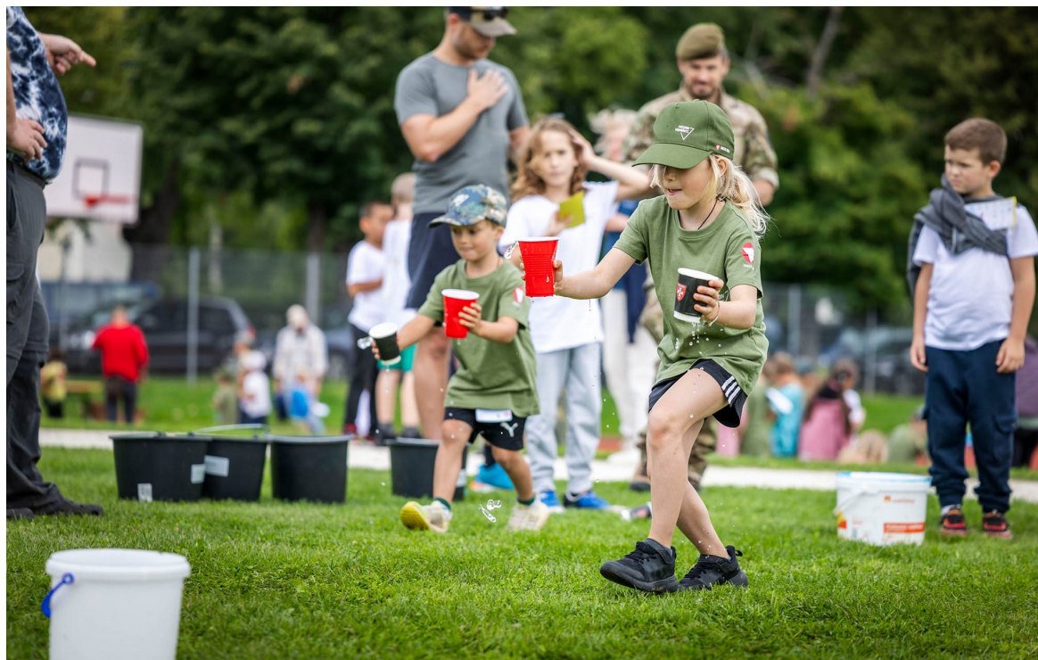
► Wasser transportieren