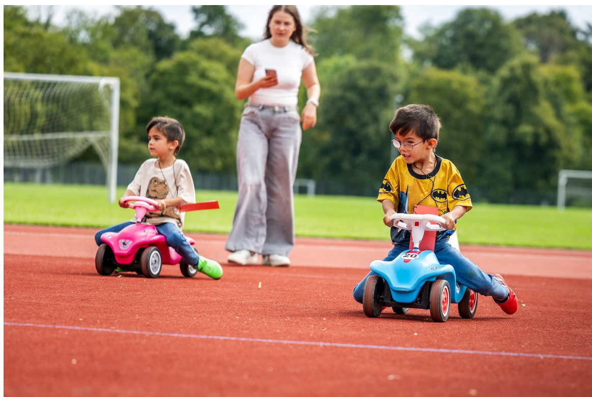
► BobbyCar Rennen